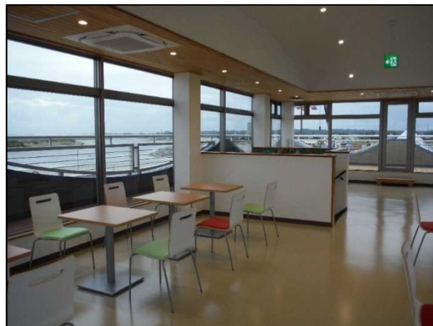
< 展望食堂 >