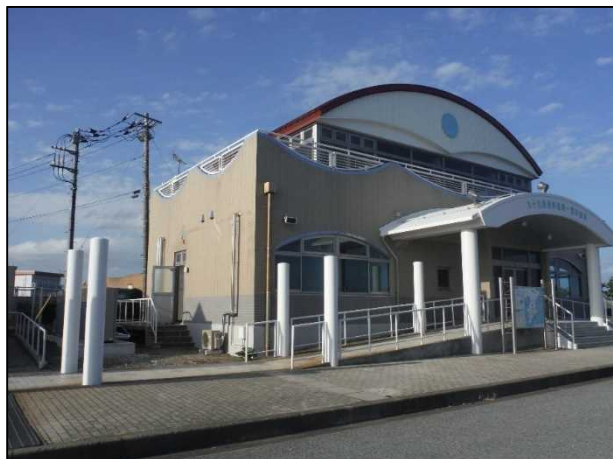
< 休憩所全景 >

九十九里有料道路内にある一宮休憩所についても、この度、売店や食堂、トイレなどの大規模な改装工事を終え、便利で快適に利用できる施設として開通日にリニューアルオープンいたします。