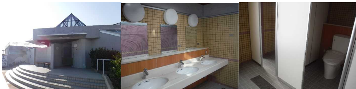
< 新しくなったトイレ >