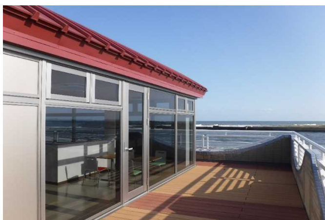
< 海が一望できるテラス >